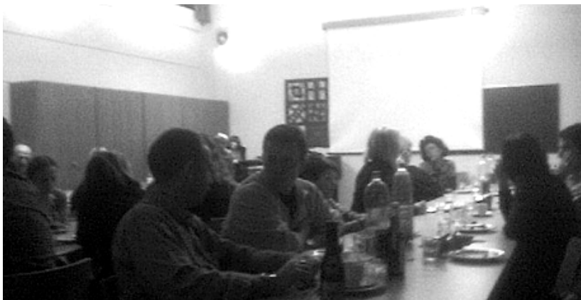
Am Ässplausch herrschte eine ausgelassene, gemütliche Stimmung.

Im Ausblick wurde das Conveniat 2009 (18.-24.7.2009) vorgestellt. Übrigens: Die Anmeldungen werden bald versendet! Ausserdem hat Strick das neue Konzept des Helas 09 verraten: Ähnlich wie das Pfila, hat man vor, das Lager mit einer anderen Abteilung zusammen zu gestalten, damit wir sagen können, es wird 100% ein Herbstlager geben.