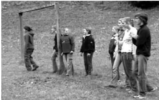
Die CevalerInnen versuchen sich im „wildsaue“.

konnten sich die Kids am Nachmittag in spannenden Workshops weiter entspannen – nur um sich auf die große Schlacht am Abend vorzubereiten! Der alles entscheidende Kampf zwischen den Wikinger